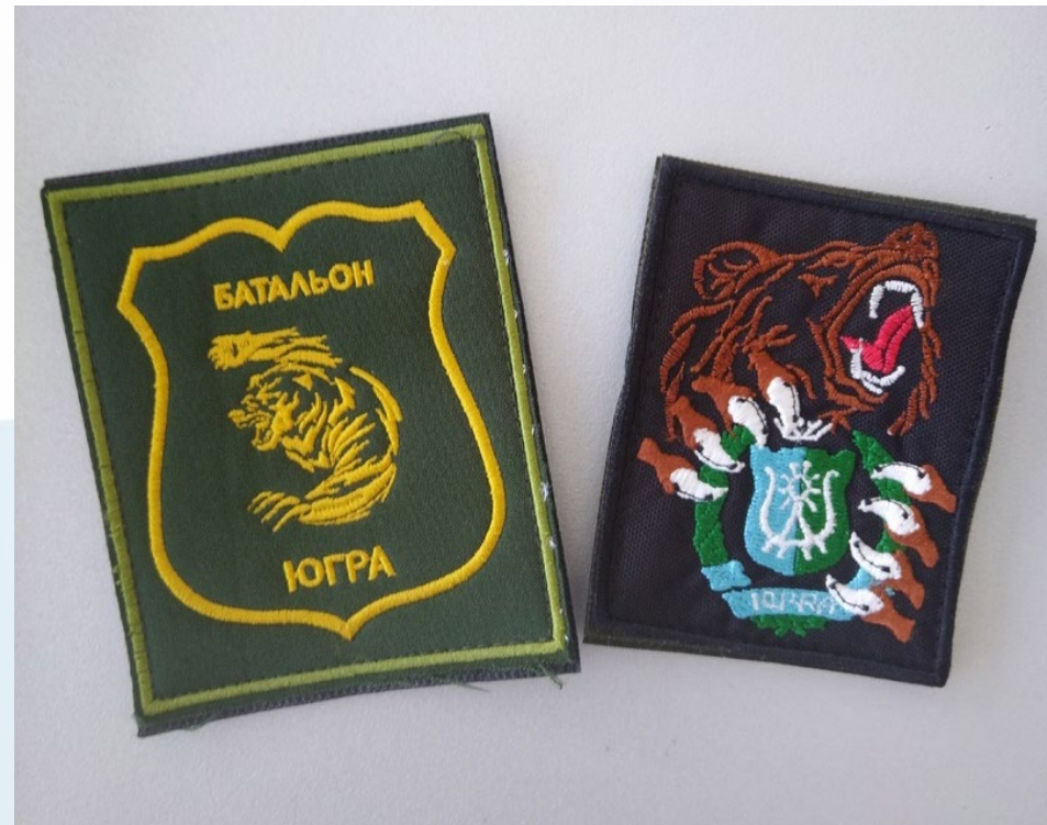
«Шевроны «Батальон Югра»»